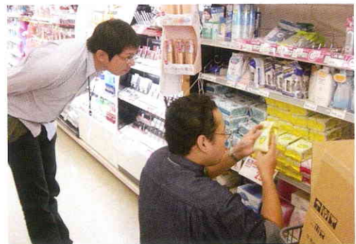
職場実習（店舗での商品整理）