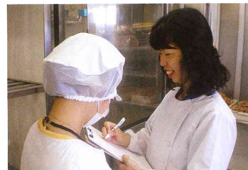
就職後の支援（職場訪問）