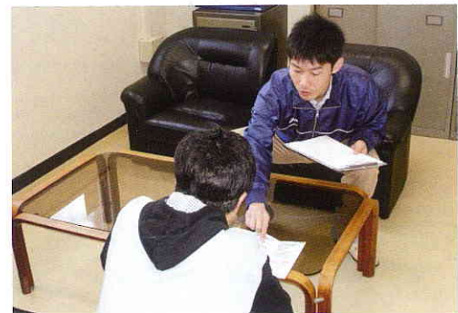
就職の準備（履歴書の書き方）