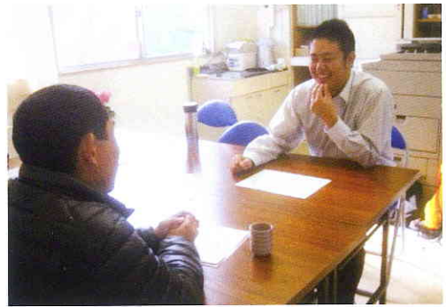
センターでの相談